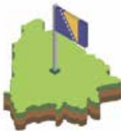
BOSNIA AND HERZEGOVINA